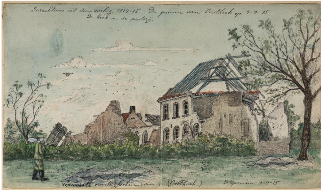
Afbeelding 5 - Gedachtenis uit den oorlog. 1914-15. De puinen van Oostkerke op 9-9-15. De kerk en de pastorie

De werken van beide vakmannen zijn vergeleken met historische foto's uit de museumcollectie. Hieronder een voorbeeld van elk.