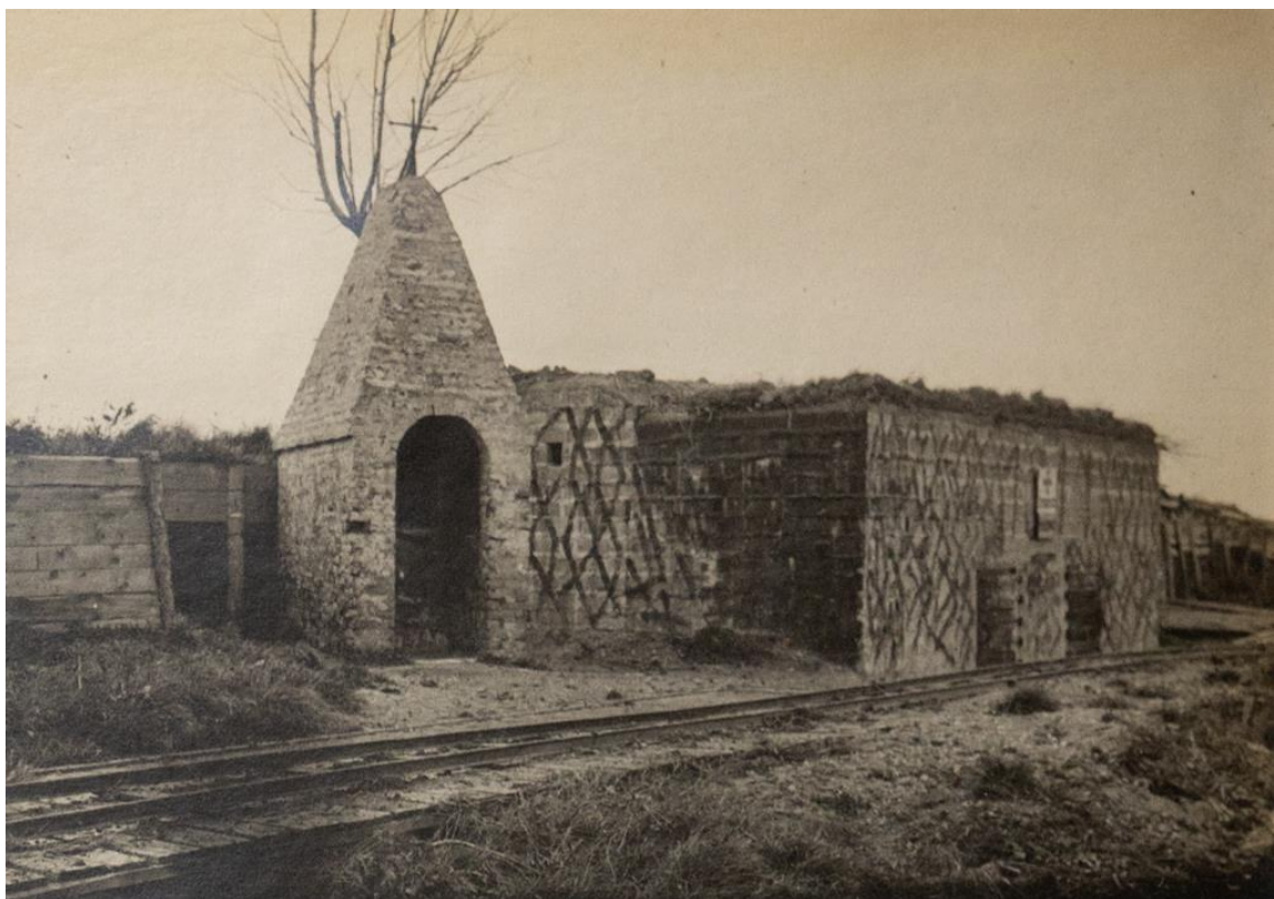
Afbeelding 8 - Zicht op de Duitse voorpost "Nazelle Ferme - Nazelle Brückenkopf", 1917, IFFFA347_000042.01