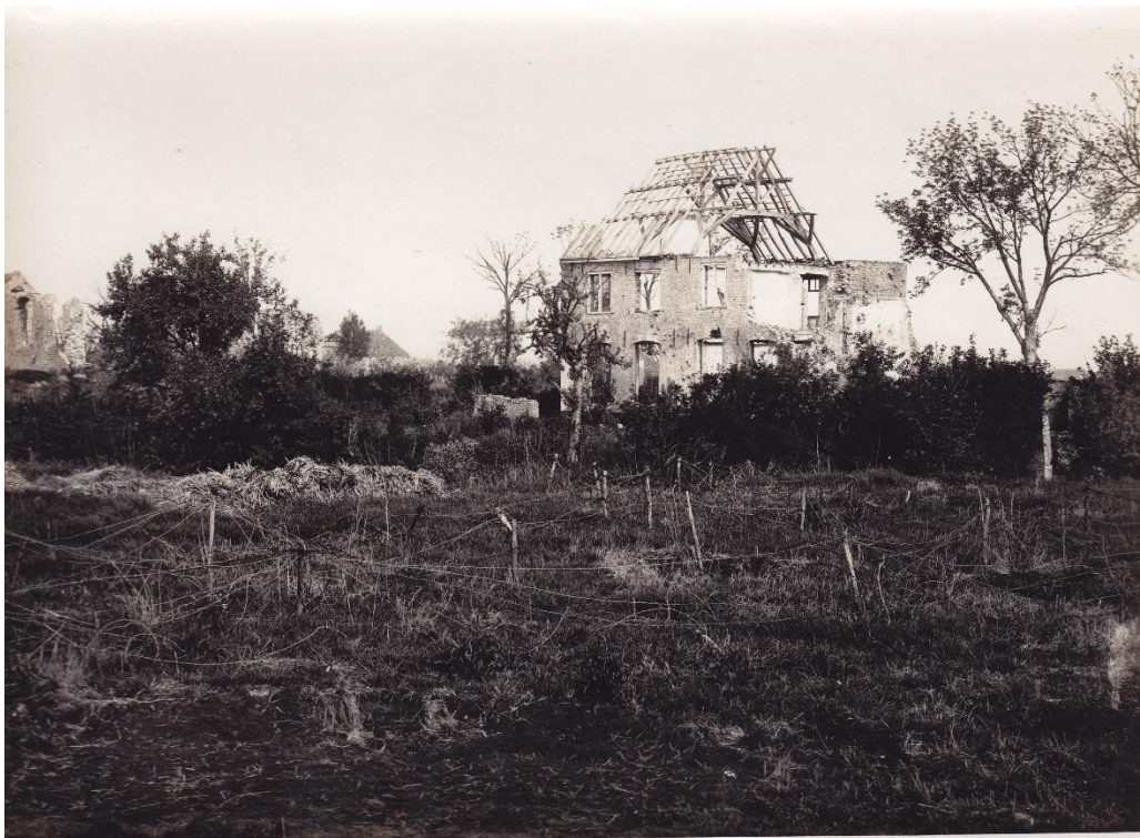
Afbeelding 6 - Ruïnes van woningen en kerk met prikkeldraadversperringen in Oostkerke (Diksmuide), 1915, IFFFC022_000057