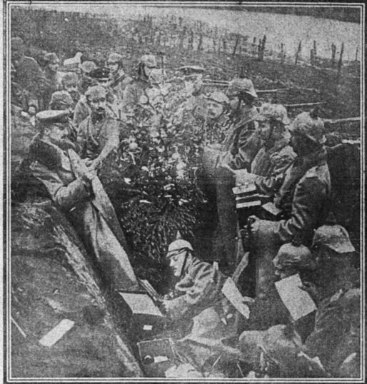
The Germans' melodeon-player accompanied the singers.