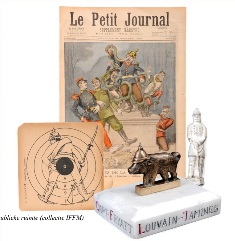
Het vijandbeeld in de publieke ruimte

In de jaren voor de Eerste Wereldoorlog hadden de mogendheden de gewoonte aangekweekt om bij elke internationale crisis via de pers een eigen versie van de feiten op te dissen. Vanaf het begin van de oorlog in augustus 1914 werd de schuld van alle onheil op een karikuraal voorgestelde, barbaarse vijand afgewenteld. Die eenzijdige berichtgeving werd gecombineerd met een algemene mobilisering van de bevolking, om dienst te nemen, om de oorlog te helpen financieren en om de interne saamhorigheid en de solidariteit tussen de natie en de bondgenoten te versterken.