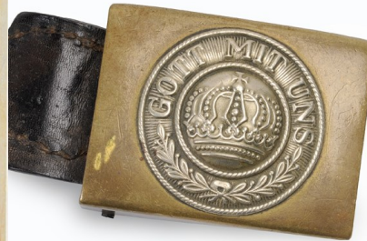
Met God aan onze zijde, Duitse riem (collectie IFFM)